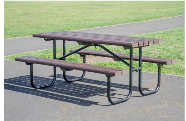
NEU Picknicktisch Bowland™