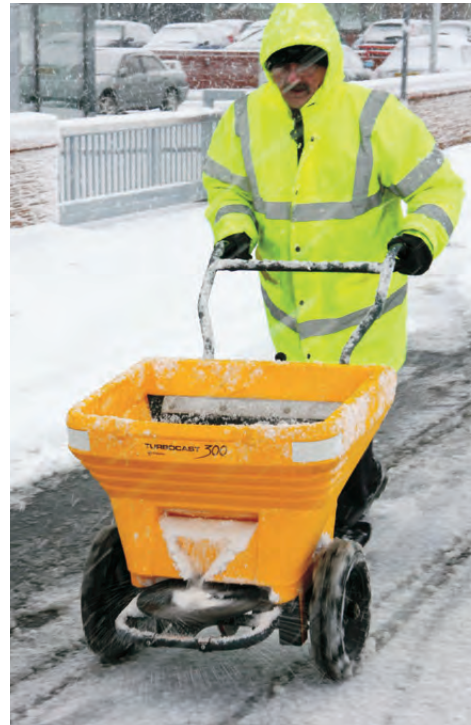
Streuwagen Cruiser™ 300