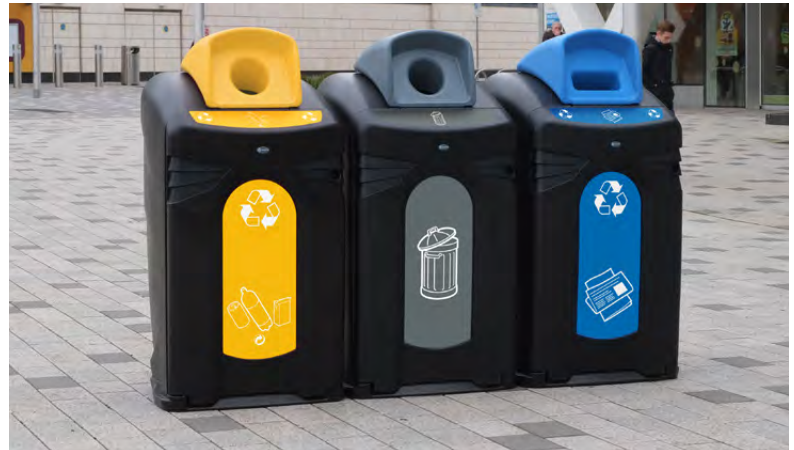
Recycling-Behälter Nexus® City 240