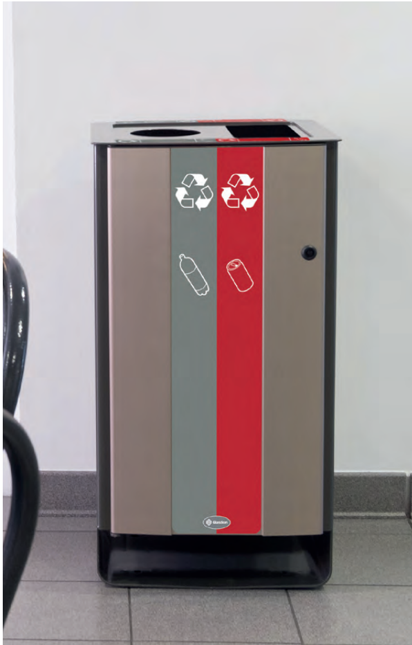
Electra™ 85 Duo Recyclingbehälter