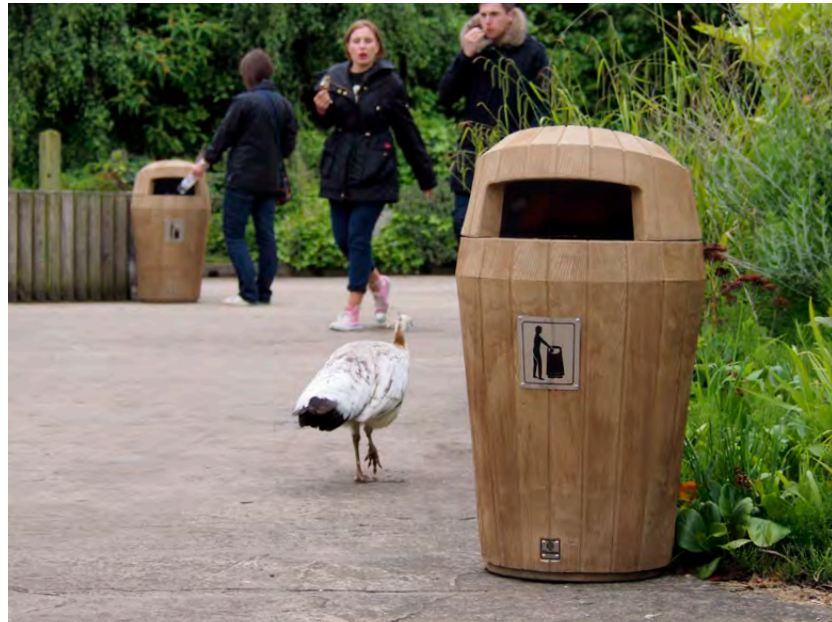
Abfallbehälter mit Haube Sherwood™

Für Ihre individuellen Bedürfnisse bieten wir eine große Auswahl an Abfallbehältern in unterschiedlichsten Preisklassen an. Viele unserer Abfallbehälter sind so gestaltet, dass eine Personalisierung nach Kundenwunsch möglich ist. Wenn Sie also überlegen, Ihren Abfallbehälter mittels alternativer Farboptionen, Ihres Firmenlogos oder eines personalisierten Schriftzugs zu etwas ganz Besonderem zu machen, gibt es eine Vielzahl an Möglichkeiten.