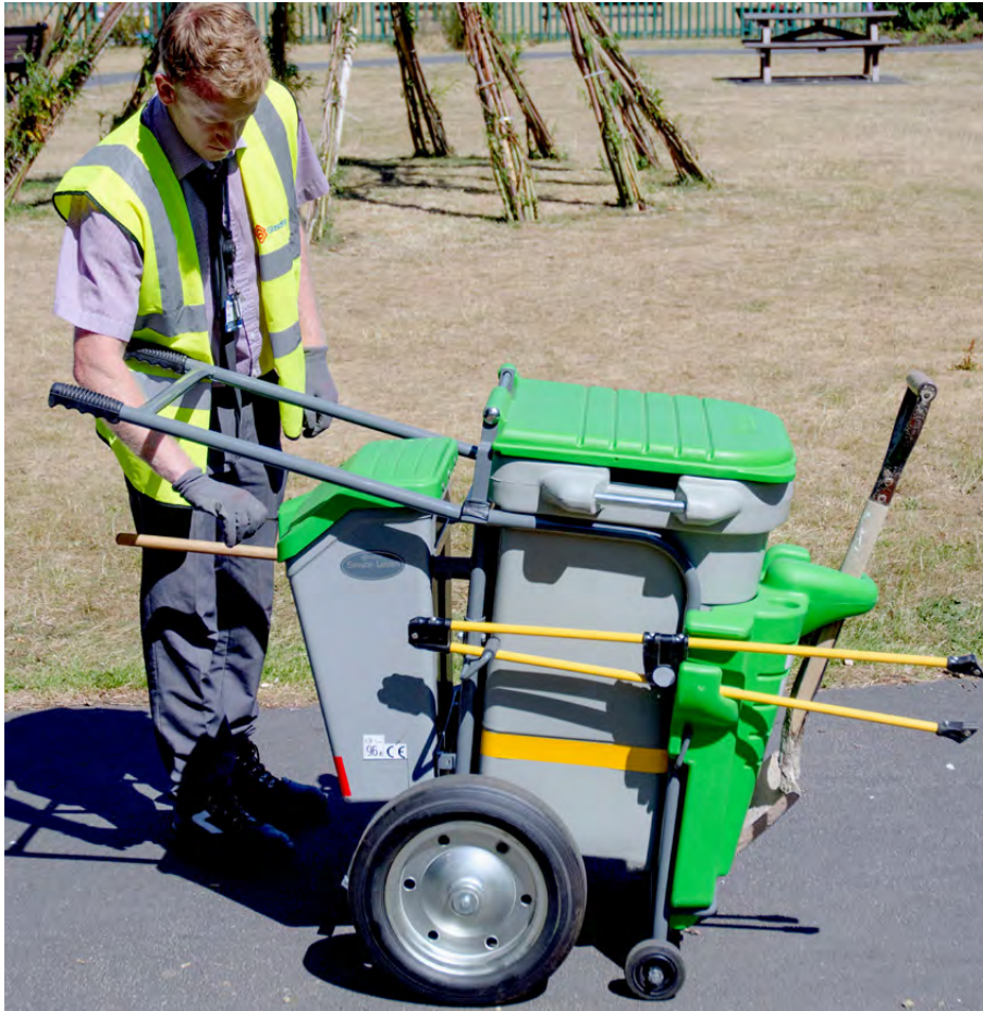
Abfallsammelwagen Space-Liner™ - Einzelmodell

Unsere vielseitigen Reinigungs- und Servicewagen sind für die Abfallsammlung, die Mülltrennung und für den Transport der Gerätschaften, welche für eine effiziente Reinigung in belebten Fußgängerzonen nötig sind, einsetzbar.