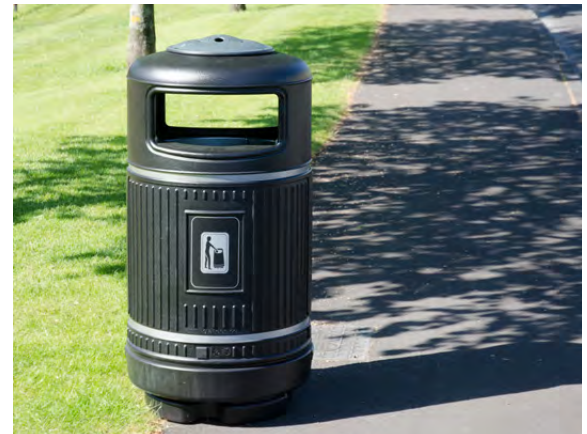
Abfallbehälter Topsy Royale™ www.glasdon.com