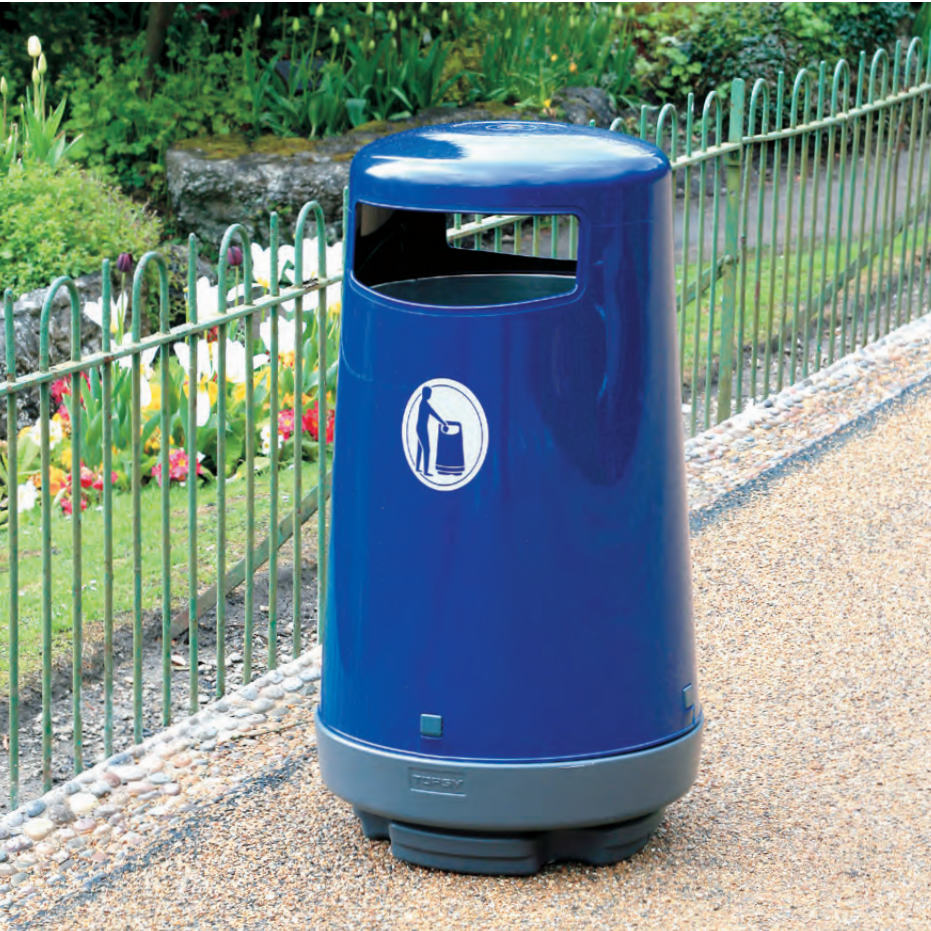
Abfallbehälter Topsy™ 2000