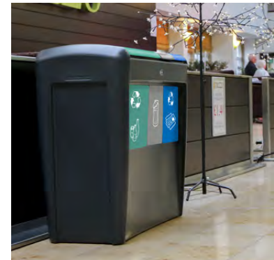
NEU Nexus® Evolution Trio Mülltrennsystem