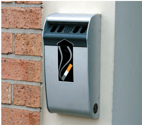
Wandascher Ashmount™ 1.5L