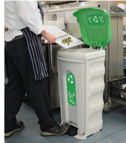
Gastronomie-Behälter Nexus® Shuttle