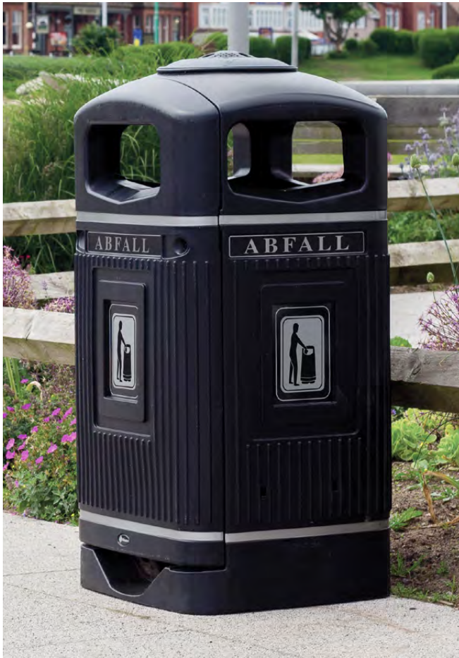
Abfallbehälter Glasdon Jubilee™ 110