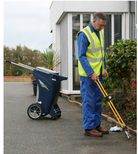
Reinigungswagen Skipper™ und Abfallpflücker Litta-Pikka™