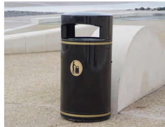
Abfallbehälter Metall Chieftain™