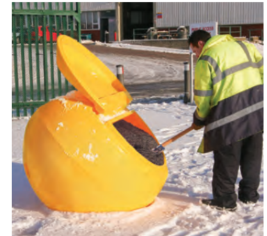
Streugutbehälter Orbistor™ 800 L