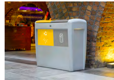
NEU Nexus® Evolution Duo Mülltrennsystem