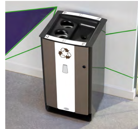
NEU Electra™ Bechersammler