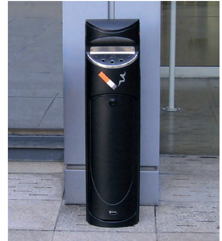
Freistehender Aschenbecher Ashguard SG™