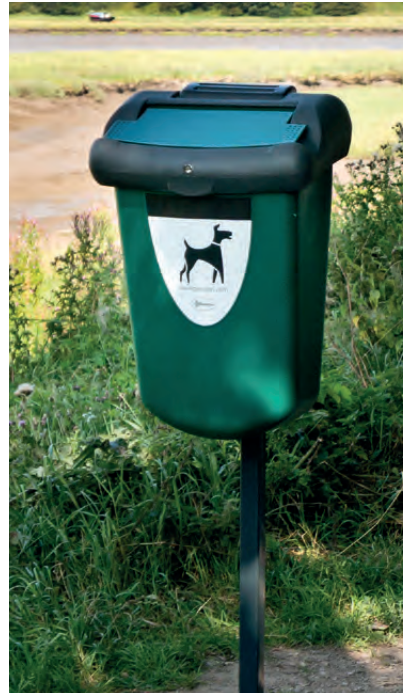
Hundetoilette Retriever 35™

Um öffentlich zugängliche Standorte von Hunde-Hinterlassenschaften sauber zu halten, bieten wir eine Reihe von äußerst stabilen und langlebigen Hundetoiletten an. Es gibt, je nach den Kundenansprüchen, verschiedene Modelle für die Montage an Pfosten oder Wänden, sowie freistehende Modelle.