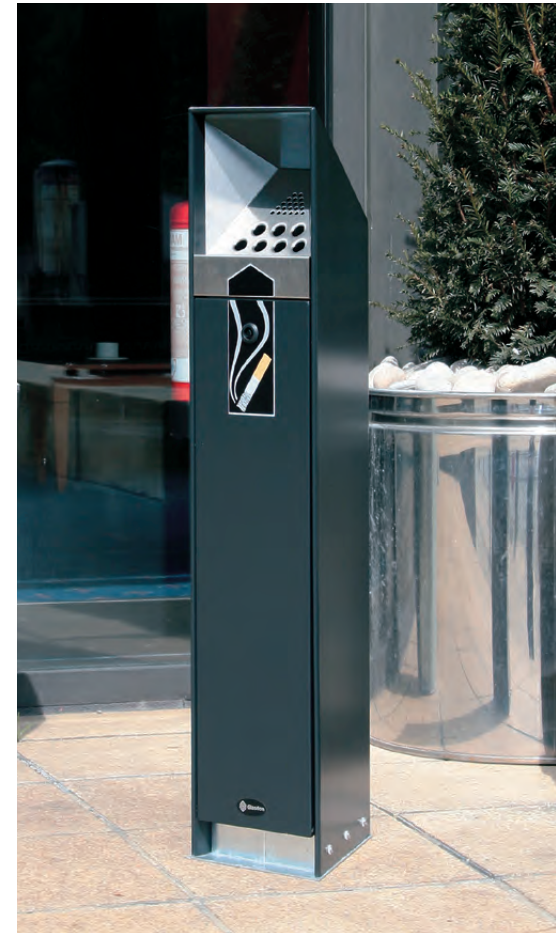
Freistehender Aschenbecher Ashguard™