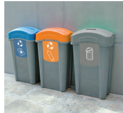
Recycling-Behälter Eco Nexus® 85