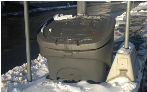
Streugutbehälter Nestor™ 400L