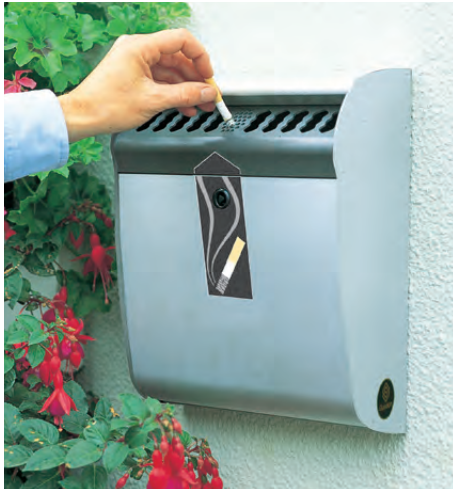
Wandascher Ashmount™ 3L