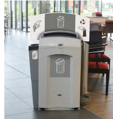
Nexus® 100 Recyclingstation