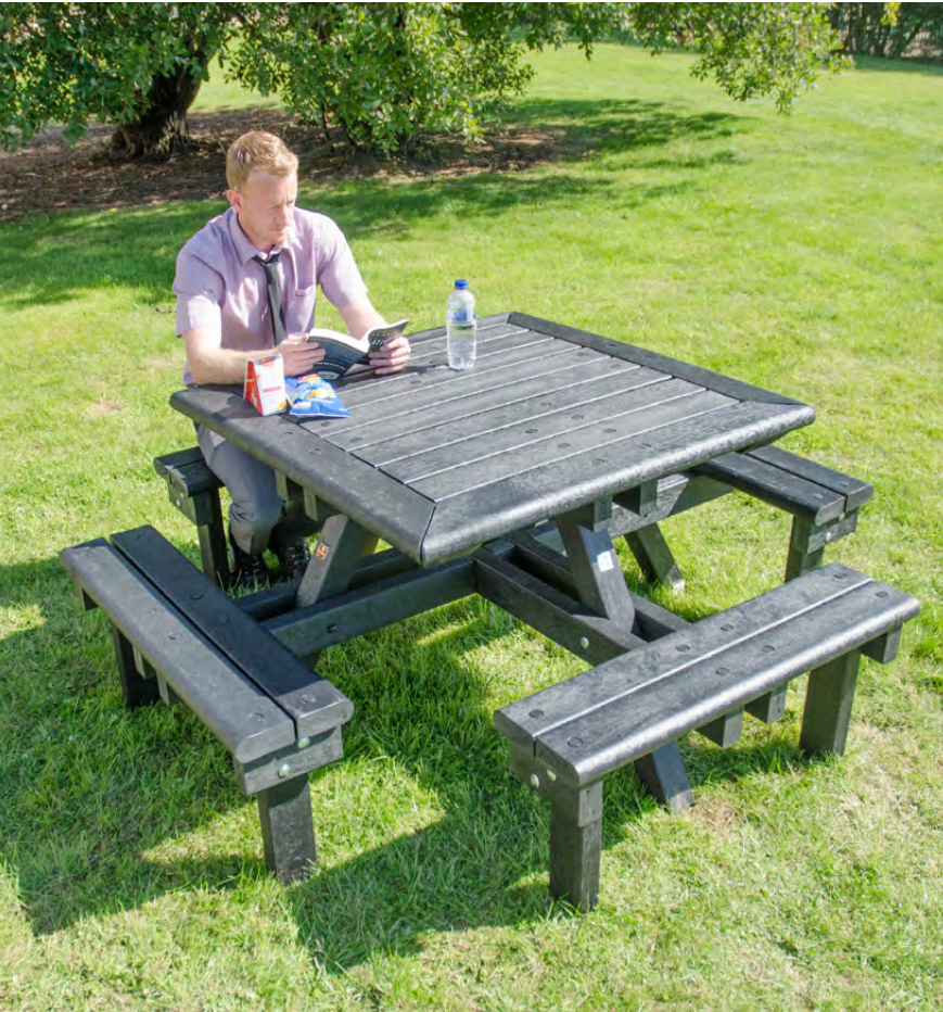
NEU Picknicktisch Pembridge™