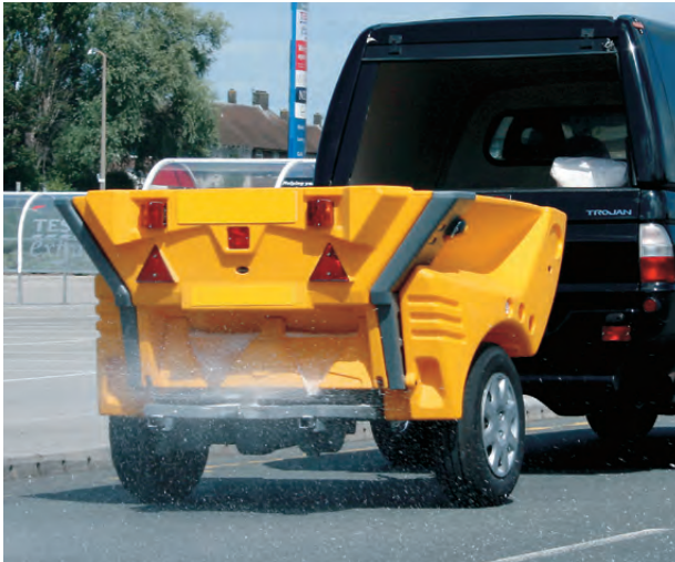
Schleppstreuwagen Cruiser™ 1000

Das Streuen Ihres Geländes ist Voraussetzung für die Sicherheit in der Winterzeit. Wir haben eine Auswahl an handbetriebenen Streuwagen und Streuwagen zum Anhängen sowie verschiedene Streugutbehälter für alle Bedürfnisse.