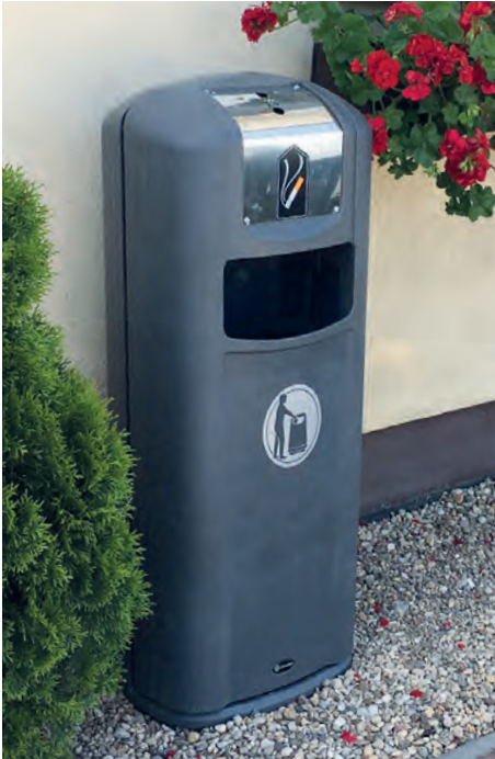
Kombinierter Abfall- und Aschebehälter Integro City™

In unserem Sortiment an Aschenbechern haben wir eine Auswahl an freistehenden Aschenbechern, sowie an Aschenbechern für die permanente Wandmontage. Des Weiteren bieten wir kombinierte Abfallbehälter/Aschenbecher mit getrennten Auffangbehältern für das sichere Sammeln von beiden, Zigaretten und Restabfall an.