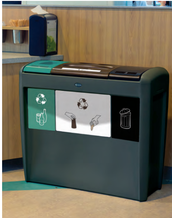
NEU Nexus® Evolution Mülltrennsystem für Becher