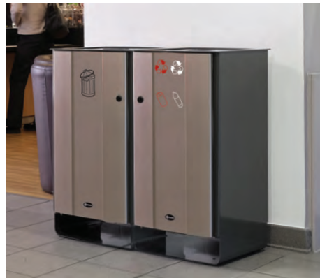
Electra™ 170 Trio Mülltrennsystem