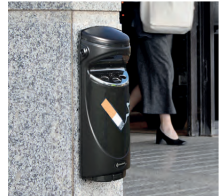
Wandascher Ashmount SG™ www.glasdon.com