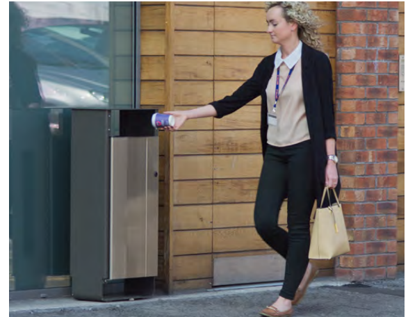
Abfallbehälter Electra™ 60