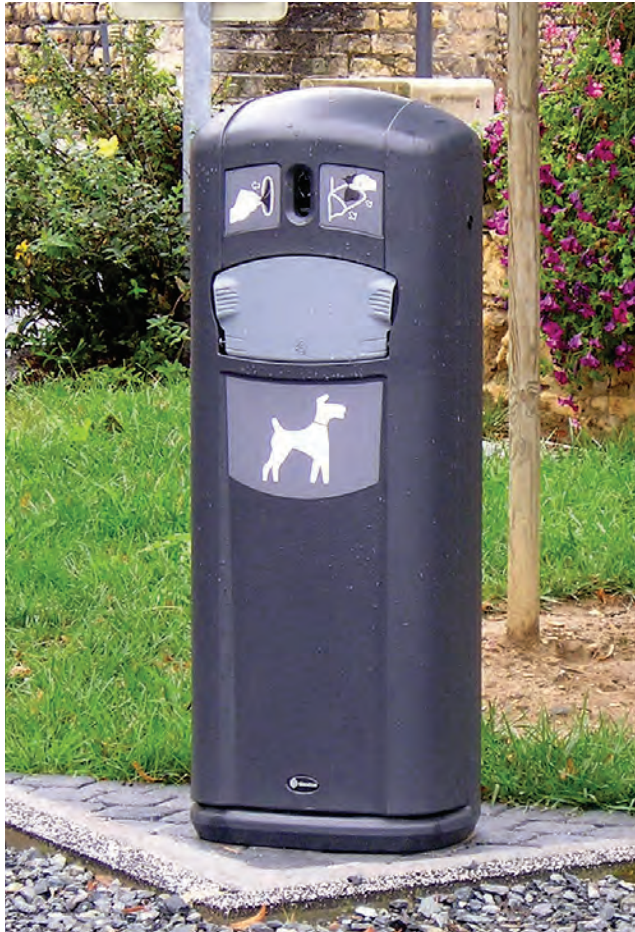
Hundetoilette Retriever City™