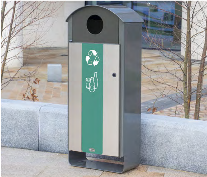
NEU Electra™ Curve 85 Mülltrennsystem