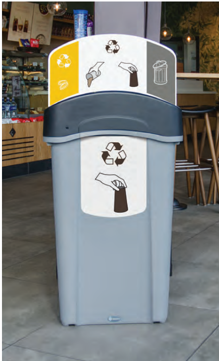
Recycling-Behälter Eco Nexus® 85

Wir können Ihnen helfen, ein effizientes Programm für die Sammlung und das Recyclen von Bechern mithilfe unserer vielseitigen Bechersammler zu implementieren. Hiermit werden die Recyclingraten von Bechern erhöht und gleichzeitig sparen Sie, durch die Reduzierung des Hausmülls, bares Geld.