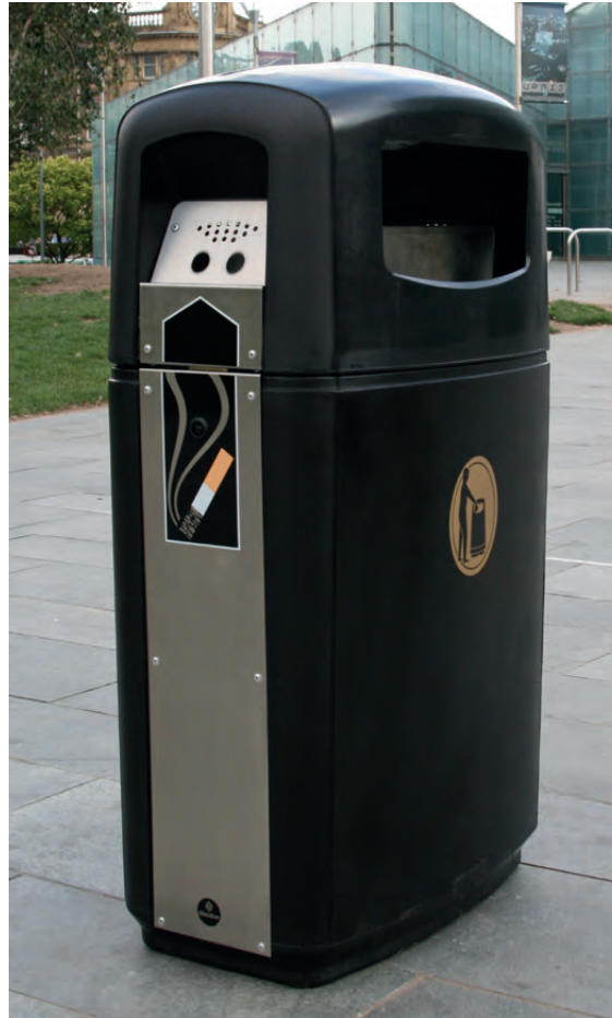
Kombinierter Abfall- und Aschebehälter Integro™