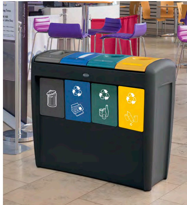
NEU Nexus® Evolution Quad Mülltrennsystem