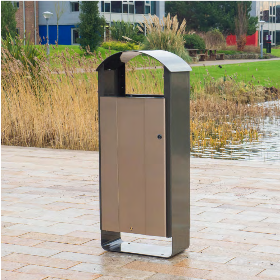
NEU Abfallbehälter Electra™ Curve 60