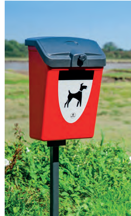
Hundetoilette Fido 25™