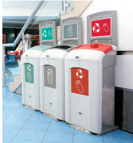
Recycling-Behälter Nexus® 100