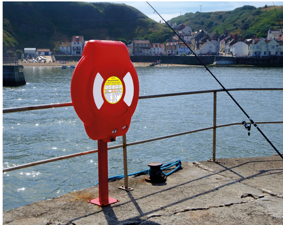
1. Guardian 750 Pfostenmontage

Das Guardian™ ist ein nicht zu übersehendes Gehäuse für Rettungsringe und anderes Rettungsmaterial. Das Gehäuse schützt ihren Inhalt durch das wetterresistente Material. Unsere Rettungsringgehäuse sind ideal für Bereiche wie Häfen, (Bade-) Strände, See- und Flussufer, Schifffahrts-Einrichtungen, (Frei-) Bäder und Klärwerke geeignet, in denen offene Wasserflächen eine Gefahr darstellen können.