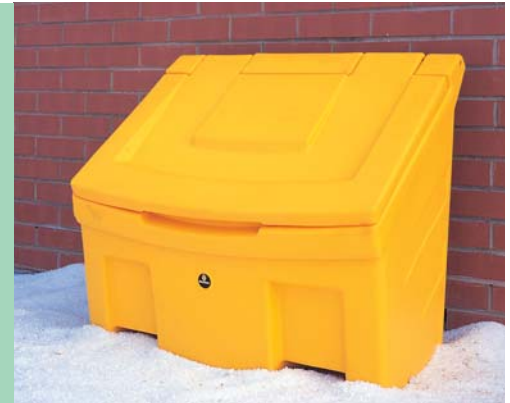
Streugutbehälter Slimline™ 160L

Das Streuen Ihres Geländes ist Voraussetzung für die Sicherheit in der Winterzeit. Wir bieten eine Auswahl an handbetriebenen Streuwagen und Streuwagen zum Anhängen sowie verschiedene Streugutbehälter für alle Bedürfnisse an.