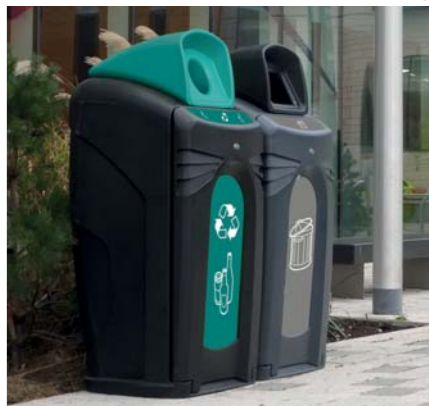
1. Recycling-Behälter Nexus® 100 2. Recycling-Behälter Nexus 50 3. Recycling-Behälter Electra 170 Trio 4. Eco Nexus Becher Recyclingstation