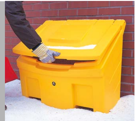
Streugutbehälter Slimline™ 160L

Das Streuen Ihres Geländes ist Voraussetzung für die Sicherheit in der Winterzeit. Wir bieten eine Auswahl an handbetriebenen Streuwagen und Streuwagen zum Anhängen sowie verschiedene Streugutbehälter für alle Bedürfnisse an.