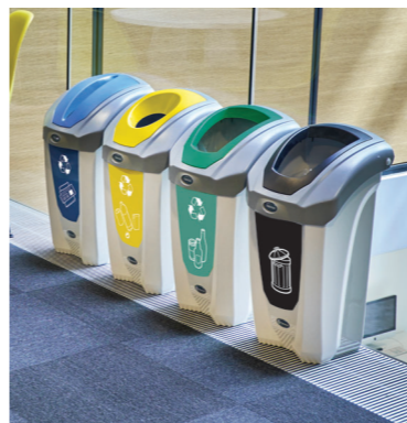
1. Recycling-Behälter Nexus® 30 2. Recycling-Behälter Eco Nexus® 60

Wir stellen eine Vielzahl an Mülltrennsystemen mit unterschiedlichen Kapazitäten und in unterschiedlichen Macharten für Innen- als auch Außenbereiche her. Dank unseres Angebotes an unterschiedlichen Einwurföffnungen und Grafiken für verschiedene Wert- und Reststoffe, können Sie leicht ein Mülltrennsystem entsprechend Ihren Anforderungen gestalten.