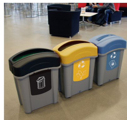
3. Recycling-Behälter Eco Nexus®