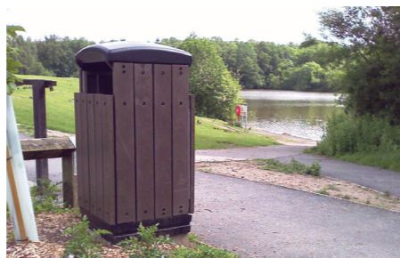
1. Abfallbehälter Enviropol™ 100